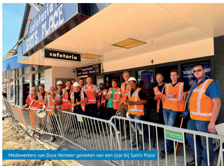
Medewerkers van Dura Vermeer genieten van een ijsje bij Sam's Place